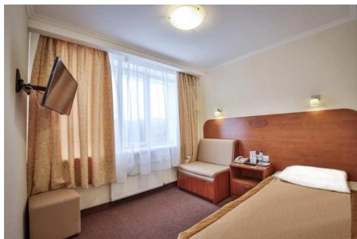
Стандарт 1местн. (13 кв.м.)