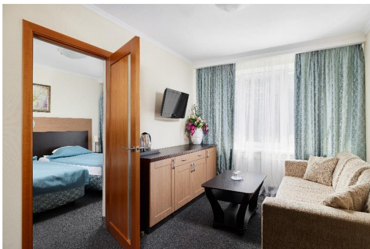
Бизнес 2комн. 2местный (28 кв.м)